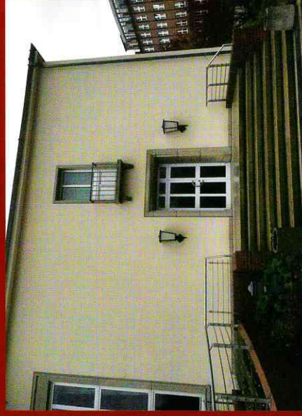
Gebäude 2.0, Räume 34 und 36 Eingang über Speisesaal

Termine können Sie telefonisch oder per E-Mail von Montag bis Freitag in der Zeit von 8.00 Uhr bis 19.00 Uhr vereinbaren.